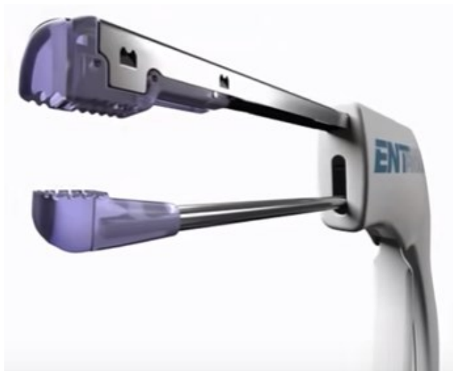
ENTACT septumstifter ladet med bioresorbarbere stifter