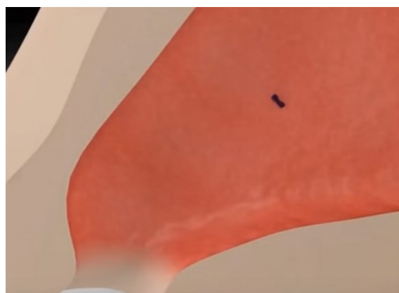
Den bioresorberbare stiften sitter igjen i nesehulen